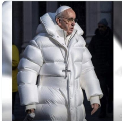
...hend echtes KI-Bild von Papst Franziskus.

Wahr oder falsch? KI Bilder werden immer besser. Florian Schmidt gibt Tipps und klärt auf. #pmafocus23